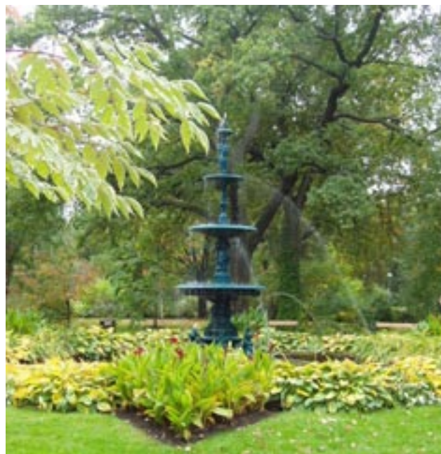
Stadsträdgården föreslogs för K-märkning. Parken anlades 1863 - 1865 och blev en omtyckt plats för karlstadsborna. Efter många års eftersatt underhåll beslöt kommunen 1993 att satsa på en utveckling. I dag är parken inte bara en plats för rekreation utan också en intressant botanisk trädgård.

Det är många saker som ger Karlstad dess karaktär som vackra byggnader, portar, gårdar, skyltar, vattenspeglar eller staket. I stadsrummet finns mycket att upptäcka som är udda eller kanske så vanligt att vi inte längre lägger märke till det. Många stadsflanörer har säkert tänkt tanken att något man uppmärksammat borde "K-märkas" och bevaras till eftervärlden. Under Kulturhusens Dag 2007 inbjöd därför föreningen till tävlingen "Vad vill du K-märka i Karlstad?" där alla hade chansen att göra sin egen K-spaning och föreslå sådant som man skulle vilja "K-märka".