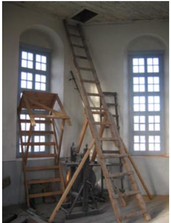
Studiecirkeln besökte bl. a. observatoriet i Gamla Gymnasiet åttkamtiga torn som annars inte är tillgängligt för allmänheten.