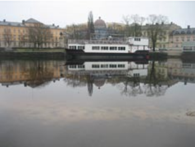
Klarälvens vattenspeglar och öppna stränder är en unik tillgång som ger Karlstad dess identitet och karaktär och borde därför göras till stadspark för att fredas från exploatering.