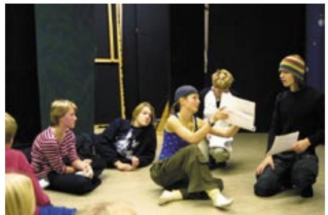
Dramalektion för Tingvallagymnasiets elever i Järnet.

Från Radio Solstás Studio Ett sändes ca 25 timmars närradio i veckan av ett sju föreningar där KarlstadRocks och Kunskapsradion stod för merparten. Studion har också fått en ansiktslyftning och en mer modern, datoriserad utrustning har installerats. Karlstads Nya Fotoklubb hade drygt 70 medlemmar och genomförde ett stort antal fotokurser för såväl nybörjare som mer erfarna fotografer. Klubblokalen har iordningställt för att vid sidan av kurs- och mötesverksamheten även kunna fungera som en mindre fotoateljé. I likhet med videoredigeringen, bokar fotoklubbens medlemmar ateljén och mörkrumstider via Café Gjuteriet.