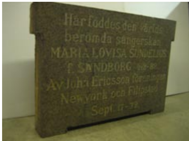
Den återfunna minnesstenen är ett bastant garnitblock med måtten 67 x 46 x 9 cm med en vikt på nära 50 kg.

Såväl NWT som Karlstads Tidningen fann historien om minnesstenens äventyr med sitt lyckliga slut så intressant att man delgav läsarna denna genom artiklar som de båda tidningarna publicerade i december.