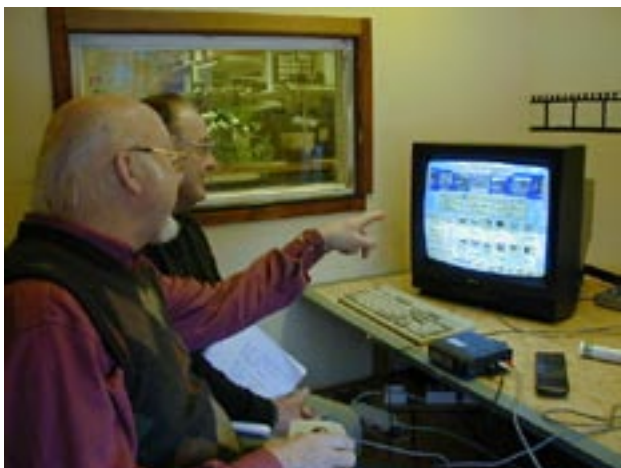
Redigering i Värmlands Filmförbunds videoverkstad.

Kursverksamheten i Studieförbundet i regi var mycket omfattande och bedrevs såväl på dagtid som på kvällar och helger i Gjuteriets lokaler. Cirklarna omfattar vitt skilda ämnen som flugfiske, jakt, fåglar, turism, hundar, stadsmiljö, måleri, orkidéodling, sociala frågor, mm. Som exempel kan nämnas att bildmåleri utövades av hela 10 grupper varje vecka och att 50-talet blivande jägare genomgick utbildning för jägarexamen. Dessa hade till och med möjlighet att öva skytte i lokalerna med hjälp av de två simulatorer som finns för ändamålet.