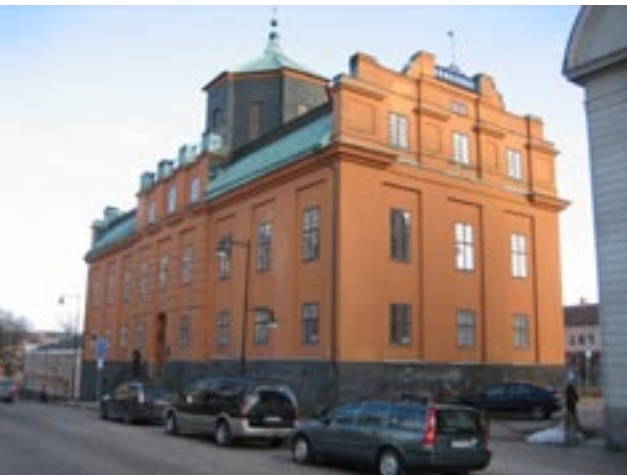
Gamla Gymnasiet som invigdes 1759 är en av stadens mest värdefulla byggnader. Den blev därför föremål för ett av cirkeldeltagarnas studiebesök under våren.