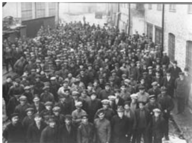
Arbetslaget samlat på Gjuteriets gård 1925.