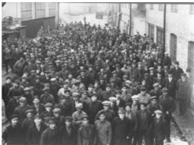
Arbetslaget samlat på Gjuteriets gård 1925.