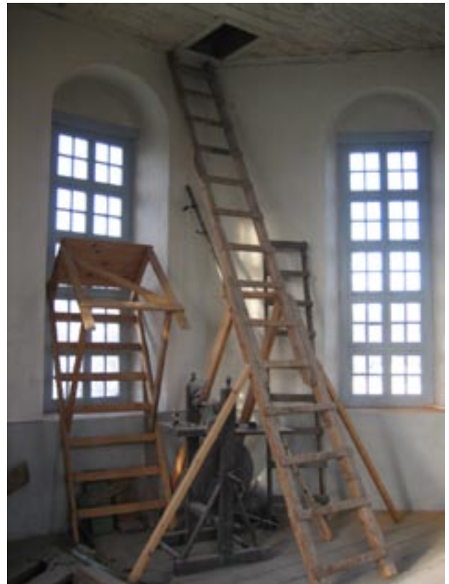
Studiecirkeln besökte bl. a. observatoriet i Gamla Gymnasiet åttkamliga torn som annars inte är tillgängligt för allmänheten.