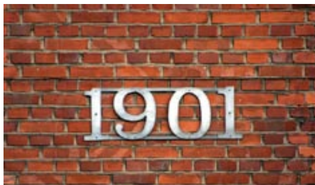
Del av tegelfasaden på Gjuteriets gård.

Gjuteriet är en gammal fastighet som har ett stort behov av ROT-renovering. Med anledning av de senaste årens dialog med kommunen för att finna en bra lösning för att åtgärda detta, föreslog kultur- och fritidsnämnden inför kommunens budgetarbete för 2007 att en uppjustering av nämndens budgetram skulle göras under femårsperiod. Dessa medel skulle då möjliggöra för föreningen att uppta ett banklån mot kommunalt avtal om bidragsstöd och därigenom kunna genomföra en del av ROT-renoveringsåtgärderna. Det visade sig dock inte möjligt med en utökning av budgetramen redan 2007. Istället uppskötts förslaget till 2008-års budgetarbete där nämnden senare beviljades en höjning med 500 000 kr per år i fem år vilket kommer att möjliggöra banklån på ca 2 milj för de allra nödvändigaste åtgärderna.