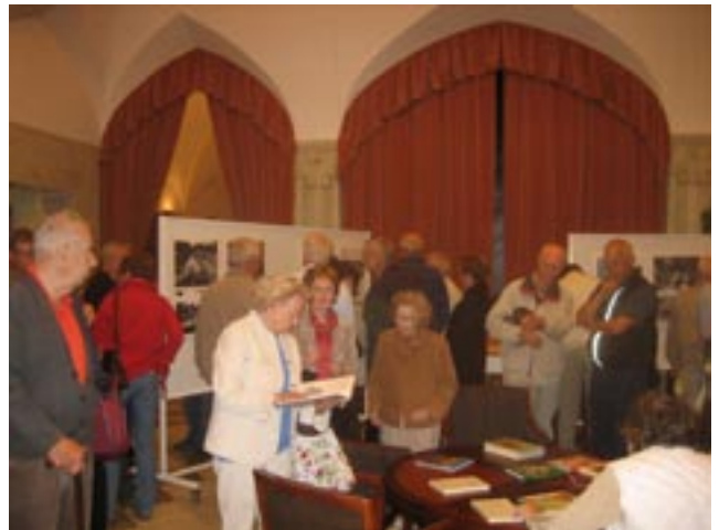
Utställningen och bokborden lockade många intresserade.