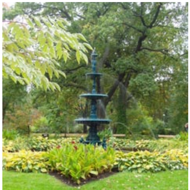
Stadsträdgården föreslogs för K-märkning. Parken anlades 1863 - 1865 och blev en omtyckt plats för karlstadsborna. Efter många års eftersatt underhåll beslöt kommunen 1993 att satsa på en utveckling. I dag är parken inte bara en plats för rekreation utan också en intressant botanisk trädgård.

Det är många saker som ger Karlstad dess karaktär som vackra byggnader, portar, gårdar, skyltar, vattenspeglar eller staket. I stadsrummet finns mycket att upptäcka som är udda eller kanske så vanligt att vi inte längre lägger märke till det. Många stadsflanörer har säkert tänkt tanken att något man uppmärksammat borde "K-märkas" och bevaras till eftervärlden. Under Kulturhusens Dag 2007 inbjöd därför föreningen till tävlingen "Vad vill du K-märka i Karlstad?" där alla hade chansen att göra sin egen K-spaning och föreslå sådant som man skulle vilja "K-märka".