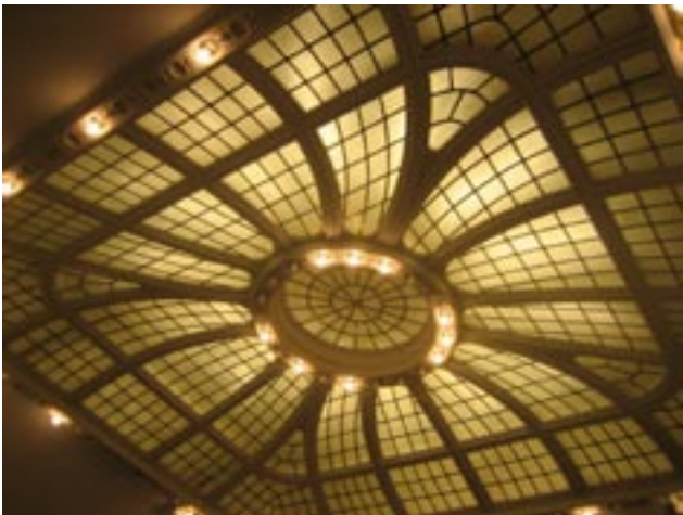
Det vackra marluxtaket i Wermlandsbankens entréhall som ger en känsla av dagsljus och rymd.

Kulturhusens dag 2007 hade temat "K-märkt" och blev en publik succé med ca 500 besökare. Planeringen påbörjades inom föreningens styrelse i början av året då ett preliminärt program med rubriken "K-märkt i Karlstad" utarbetades. Intentionen var att arrangemanget skulle ge information om att "K-märkt" är ett samlingsbegrepp för många olika typer av lagskydd för kulturhistoriskt värdefulla hus och miljöer samt att ge exempel på vad som för närvarande är skyddat i Karlstad. Kontakter togs med tänkbara medarrangörer som inbjöds till en planeringsträff 2007-05-15 hos Carlstads-Gillet i Wermlandsbanken. Deltagare var Pererik Ekeberg, Hans Olsson, Elisabet Larberg, Krister Lundgren, Sven Mæchel och Peter Sörensen (Föreningen Karlstad Lever), Anders Ek (Kultur- och fritidsförvaltningen), Andreas Eliazon (Stadsplaneringsförvaltningen), Per Berggrén och Martin Edman (Carlstads-Gillet), Carl-Göran Tollesby och Lenart Fernqvist (Karlstads Hembygdsförening) samt Erika Hedenskog (Länsstyrelsen). I likhet med tidigare år beslöts att i samband med arrangemanget ge ut en skrift med rubriken K-märkt som behandlade de kulturminnen som finns i Karlstad och de som försvunnit. Till redaktionsgrupp utsågs av Peter Sörensen, Elisabet Larberg och Hans Olsson. Ytterligare ett stort antal personer kom senare att delta i det praktiska planeringsarbetet inom de olika medarrangerande föreningarna och organisationerna.