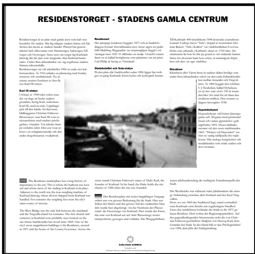
Den ännu inte uppsatta informationsskylten för Residenstorget med omnejd.

Stadsbyggnadskontoret, Kultur- och fritidsförvaltningen, Tekniska verken, Carlstadsgillet, Karlstads hembygdsförening och Värmlands Museum. Under året har en skylt färdigställt för Residenstorget. Den invigdes provisoriskt i samband med firandet av Kulturhusens dag. I avvaktan på att finna den lämpligaste platsen för skyltens placering har den ännu inte satts upp permanent. Gruppen arbetar för närvarande med stadsdelskyltar till Rud, Råtorp och Viken samt skyltar för dykdalberna i Klarälvens östra gren, Sandgrundsudden, Stadsträdgården och Lagberget, där domkyrkan ligger.