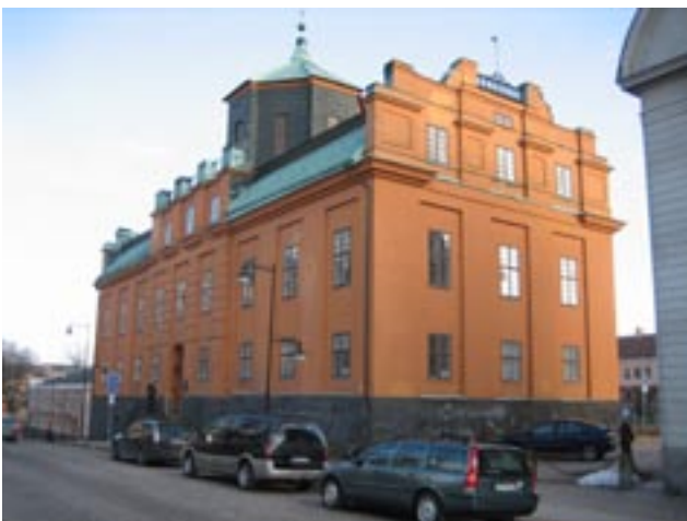
Gamla Gymnasiet som invigdes 1759 är en av stadens mest värdefulla byggnader. Den blev därför föremål för ett av cirkeldeltagarnas studiebesök under våren.