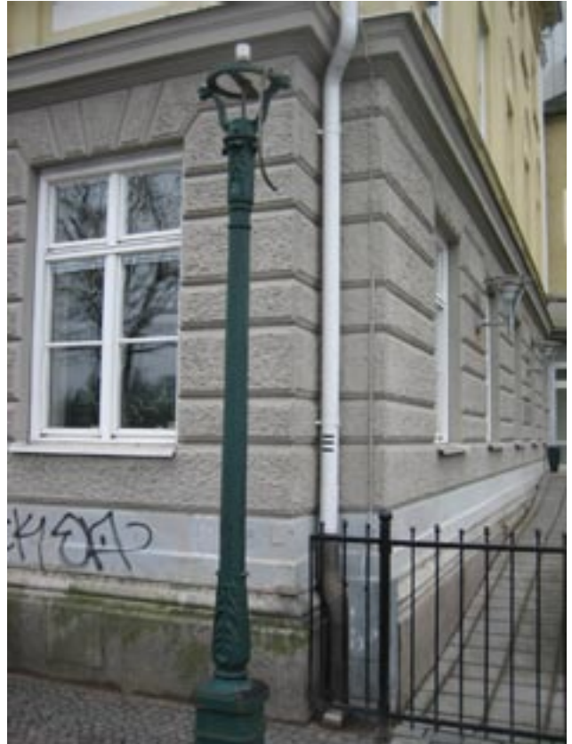
Bristande underhåll av gjutjärnlyktorna utmed Älvgatan.

från medlemmar. Här påpekades bl a felaktig renovering av träbroarna på Borgmästarholmen, förfulande ljusskyltar på Riksbankshuset och vid Länsstyrelsen, bristande underhåll av de gamla gatlyktorna utmed Älvgatan och krav på att Prämen vid Residensparken flyttas från detta kulturhistoriskt värdefulla och estetiskt känsliga område så att man bättre tar tillvara platsens ursprungliga karaktär.