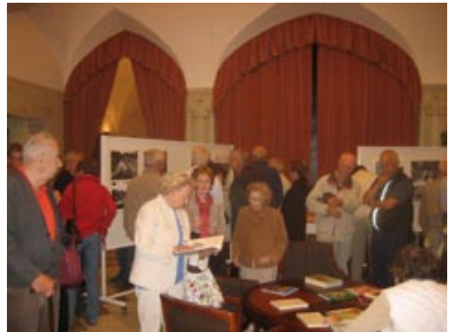
Utställningen och bokborden lockade många intresserade.