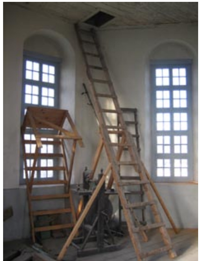
Studiecirkeln besökte bl. a. observatoriet i Gamla Gymnasiet åttkamtiga torn som annars inte är tillgängligt för allmänheten.