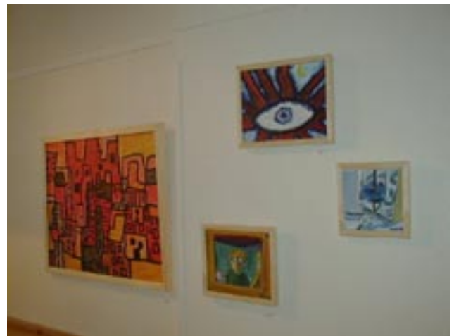
Bildutställning i Café Gjuteriet.

Den intima cafélokalen på Gjuteriet har i många år fungerat som en mötesplats där engagerade åhörare och Bokcaféets föreläsare kunnat mötas i givande diskussioner. Under året arrangerade Bokcaféet fem föredrag på Gjuteriet. Bokcaféets permanenta tidskriftshylla i cafélokalen finns kvar och erbjuder en rad tidskrifter som annars kan vara svåra att uppbbringa i Karlstad.