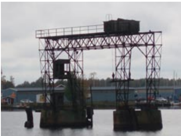
Buntkranen i Yttre hamnen var ett av förslagen till tävlingen "Vad vill du K-märka?". Den byggdes förmodligen på 1920-talet och användes för att bunta timmer. Dessa bands sedan ihop till långa timmermosor som flottades över Väneren till Vargön. Kranen var i drift fram till 1965 då lastbilar tog över transporten.

Förutom de som nämnts ovan bidrog ytterligare enskilda personer och medarbetare inom de olika medverkande föreningarna och organisationerna på olika sätt med sitt ideella arbete och engagemang för att göra Kulturhusens Dag till ett uppskattat och välbesökt arrangemang. Sammanlagt var ett 30-tal personer involverade i förberedelserna och genomförandet som med gemensamma krafter levandegjorde Karlstads kulturhistoria på ett mångfacetterat sätt. Arrangörer var förutom Föreningen Karlstad Lever: Carlstads-Gillet, Karlstads Hembygdsförening, Värmlandsarkiv, Värmlands Museum och Karlstads kommuns kultur- och fritidsnämnd och stadsplaneringsförvaltning.