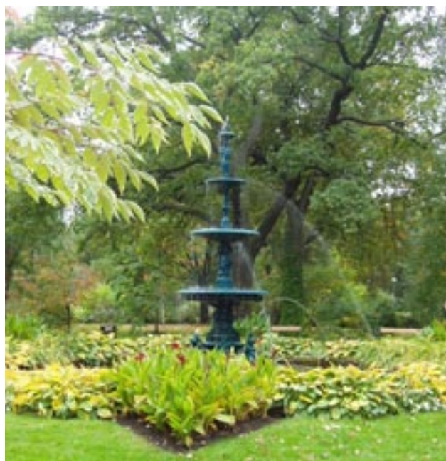
Stadsträdgården föreslogs för K-märkning. Parken anlades 1863 - 1865 och blev en omtyckt plats för karlstadsborna. Efter många års eftersatt underhåll beslöt kommunen 1993 att satsa på en utveckling. I dag är parken inte bara en plats för rekreation utan också en intressant botanisk trädgård.

Det är många saker som ger Karlstad dess karaktär som vackra byggnader, portar, gårdar, skyltar, vattenspeglar eller staket. I stadsrummet finns mycket att upptäcka som är udda eller kanske så vanligt att vi inte längre lägger märke till det. Många stadsflanörer har säkert tänkt tanken att något man uppmärksammat borde "K-märkas" och bevaras till eftervärlden. Under Kulturhusens Dag 2007 inbjöd därför föreningen till tävlingen "Vad vill du K-märka i Karlstad?" där alla hade chansen att göra sin egen K-spaning och föreslå sådant som man skulle vilja "K-märka".