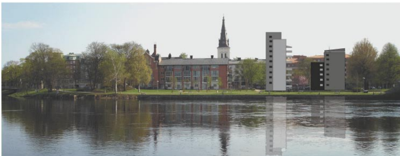
Badhusparken är en synnerligen olämplig plats för förtätning med höghusbebyggelse.