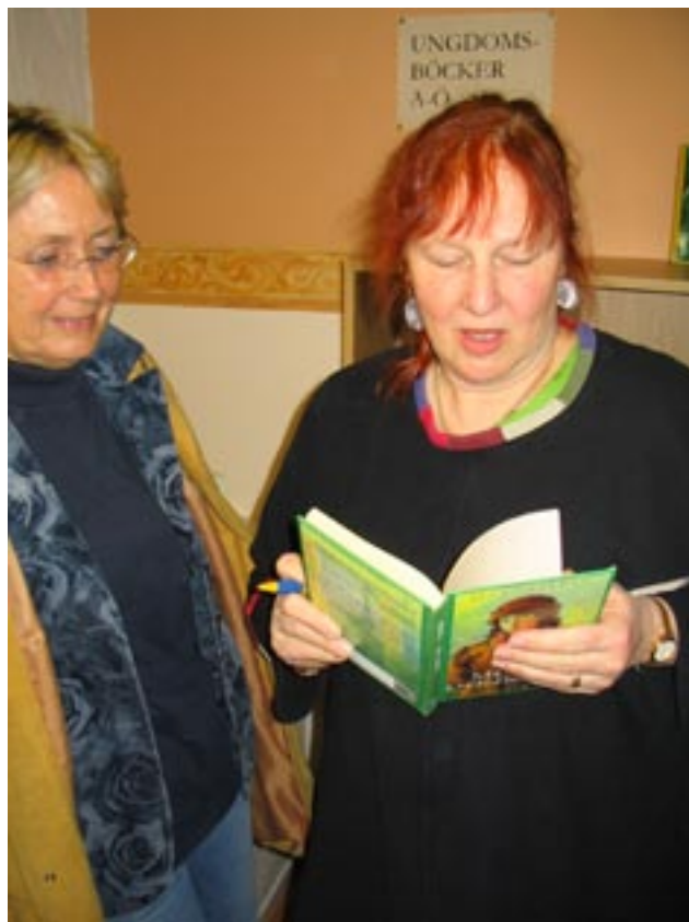
Läsvärt hittas i Obrända Biblioteket.

Vinden har fungerat som repetitionslokal för Teaterskolan och för intern kursverksamhet. Den har dessutom i stor omfattning upplåtits till ett antal föreningar och grupper för arrangemang, möten, kurser mm.