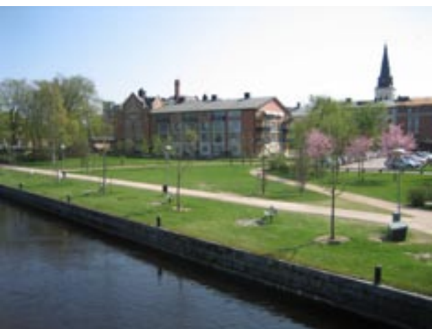
Badhusparken som nu hotas att bebyggas.

I skrivelse till stadsbyggnadsförvaltningen 2007-04-24 uttryckte föreningen sin förvåning över att byggnadsnämnden uppdragit åt stadsbyggnadsförvaltningen att ta fram förslag till planändring för området vid Badhusparken, innan förutsättningarna för detta klarlagts ordentligt genom en studie av förtättnings- och omvandlingsmöjligheterna inom Karlstads centrala delar. Vidare avstyrkte föreningen planerna på byggnation i Badhusparken eftersom den har en framträdande roll i stadsbilden som en öppen, luftig och mjuk entré till stenstaden och är en del av det attraktiva sammanhängande gröna promenadstråket utmed Klarälven. Mot denna bakgrund är badhusparken inte en lämplig plats för förtätning eller läge för expensiv och identitetsskapande exploatering. Föreningen föreslog istället att parken utvecklas med träd och grönska med en utformning av parkeringsmöjligheterna där bilarna får underordna sig parkkaraktären, en så kallad grön parkering.