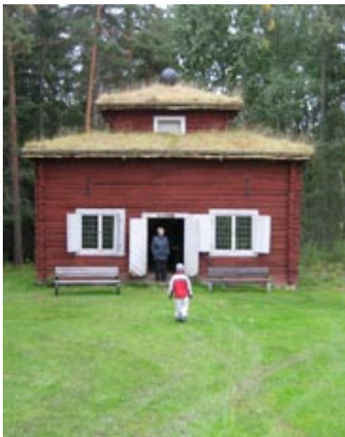
Jakt- och fiskestugan uppfördes ursprungligen på Kummelön under 1700-talets sista tredjedel. Den kan således inte ha nyttjats av Karl IX som levde 1550 - 1611.