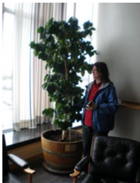
En av kaffebuskarna i festvåningen.