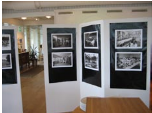
Värmlands Museums fotoutställning med bilder från det svunna Karlstad.

På Restaurang Terrassen visades fotoutställningen Svunna miljöer för mat och dryck med bilder ur Värmlands Museums arkiv. Här kunde åskådarna genom Dan Gunners foton återuppleva ett tjugotal karlstadsmiljöer och hus som byggts för framställning, tillredning och utskänkning av mat och dryck, bl a interiörer från Grands matsal och Kooperativa i Mariedal som de såg ut på 1930-talet samt Karlstads Spisbrödsfabrik som låg på Långgatan 31 under åren 1910 - 1935.