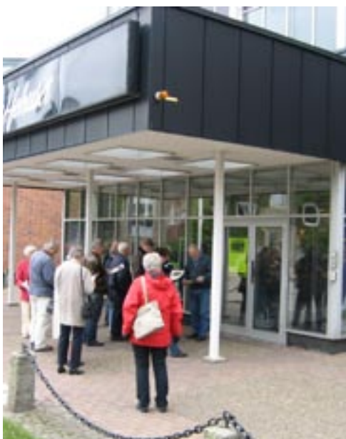
Kulturhusens Dag 2008 kl 10.30.