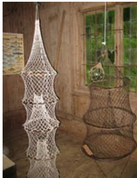
Jakt- och fiskestugan fungerar utmärkt som utställningslokal. Många besökare under Kulturhusens Dag fick uppleva stugans interiör för första gången.