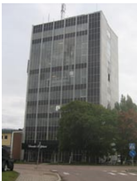
Kaffeskrapan uppförd 1960.